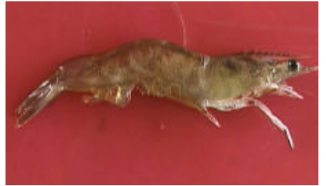
Figura 26: Grau TRÊS (G - 03)