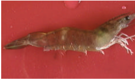
Figura 25: Grau DOIS (G - 02)