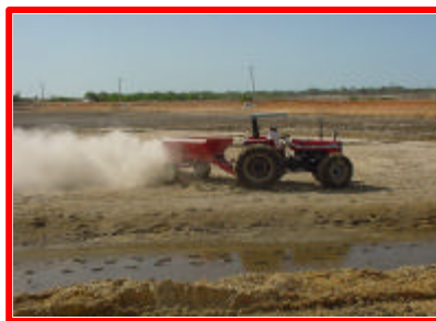
Figura 17: Distribuição manual de calcário.