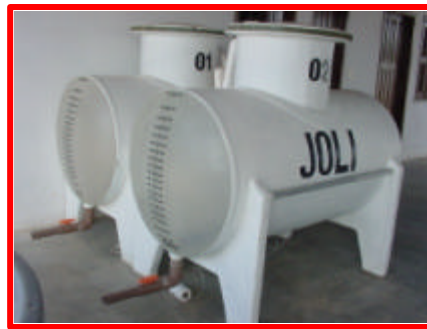
Figura 8: Submarinos de transporte de PL's.

As fotos de 4 a 8 apresentam insumos, utensílios e equipamentos que devem ser adquiridos seguindo um controle rígido quanto à qualidade, ao uso eficiente a que se propõem e ao local adequado para armazenamento e fácil higienização.