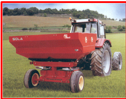
Figura 7: Distribuidor de calcário.