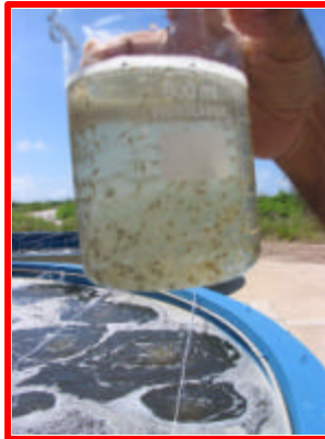
Figura 14: Checagem de PL's.