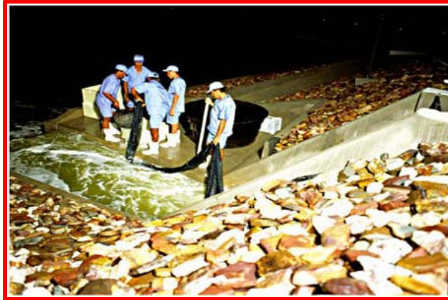
Figura 28: Operação de despesca