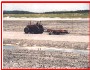
Figura 16: Revolvimento mecanizado.