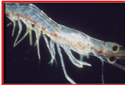
Figura 12: Pós-larva.