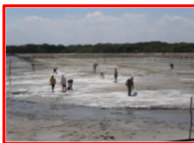
Figura 19: Distribuição mecanizada de Calcário.

As fotos 16 a 19 apresentam etapas do processo de preparação do solo, desde o revolvimento até a calagem mecanizada e a manual.