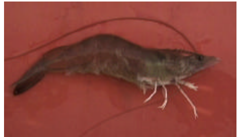
Figura 24: Grau UM (G - 01)