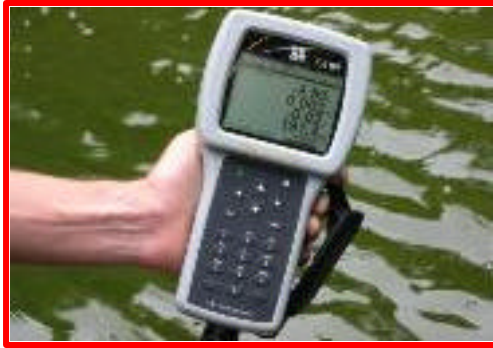
Figura 21: Aparelho de mensuração de O.D.

A manutenção dos níveis ideais para os parâmetros de qualidade da água é essencial para evitar o desencadeamento de enfermidades.