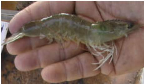
Figura 23: Grau ZERO (G -00)

A análise de prevalência indicará a evolução visual da enfermidade e seu resultado servirá para tomar decisões sobre estratégias de alimentação e de despesca emergencial. Nas figuras de 23 a 27 encontram-se características sugestivas do grau de severidade do IMNV que pode ser observado em qualquer dos segmentos do abdômen do camarão.