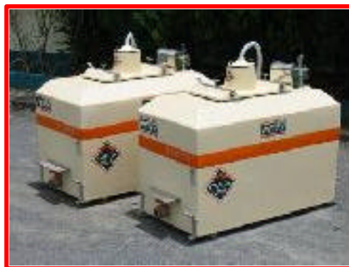
Figura 13: Caixas de transporte de PL's.

desta forma o metabolismo dos animais é reduzido e, conseqüentemente, se reduzem o consumo de alimentos, o oxigênio e as alterações no pH.