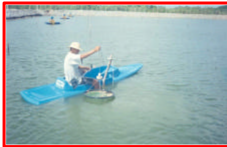
Figura 20: Arraçoamento.

Quanto ao manejo alimentar como estratégia de reduzir o estresse, a poluição do ambiente de cultivo e as perdas econômicas com as altas taxas de FCA, deve-se considerar: