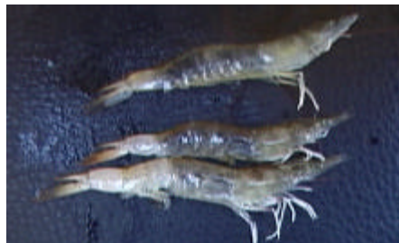
Figura 27: Grau QUATRO (G - 04)