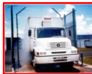
Figura 1: Sanitização com fumigador.