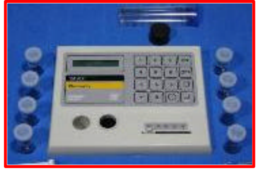
Figura 22: Fotocolorímetro.

A figura 21 apresenta um Oxímetro (medição de Oxigênio dissolvido e temperatura) e a figura 22, um Fotocolorímetro (medição de alcalinidade, dureza, pH, amônia, nitrito, nitrato).